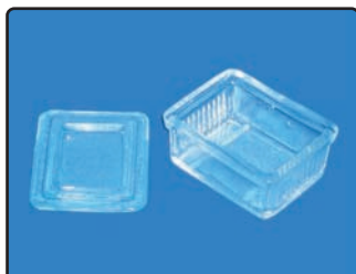
BARWIACZ DO SZKIEŁEK MIKROSKOPOWYCH POZIOMY