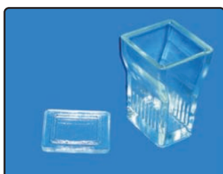
BARWIACZ DO SZKIEŁEK MIKROSKOPOWYCH PIONOWY